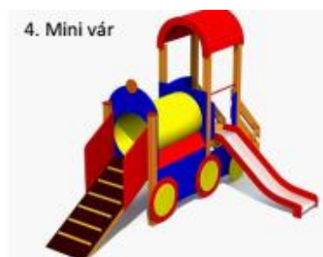
4. Mini vár