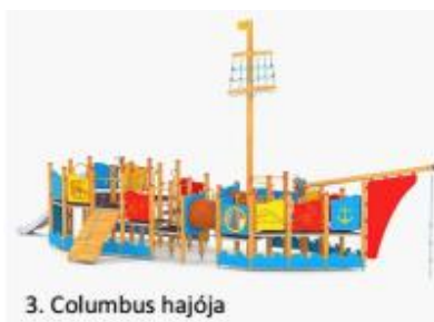
3. Columbus hajója